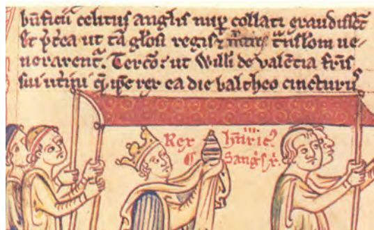
Abbildung 3: Matthew Paris, König Heinrich III. bei der Translation des Heiligen Blutes

Auch in Jerusalem verwahrte man das Heilige Blut in einem Kristallbehälter. Im Jahr 1247 wurde diese kostbare Reliquie von Jerusalem nach England gebracht, wo sie König Heinrich III. der Westminster Abbey übergab. In seinem Begleitschreiben erwähnt der damalige Patriarch von Jerusalem, dass die Blutreliquie in einem kostbaren Gefäß eingeschlossen war: „ vasum cristallinum venustissimum “ (ein sehr altes Kristallgefäß). 24 In seiner zwischen 1250 und 1255 entstandenen Historia Anglorum zeichnet Matthew Paris den König bei der Translation des kostbaren Blutes (Abb. 3). Unter einem Baldachin schreitend, hält er mit verhüllten Händen das von zwei Goldbändern gefasste und mit einem konischen Deckel verschlossene Kristallgefäß empor (Cambridge, Corpus Christi College MS 16, fol. 215; Abb. 3). Auch wenn es sich sicher um eine vereinfachte Zeichnung handelt, ist eine Verwandtschaft zu überlieferten Bergkristallflakons nicht von der Hand zu weisen.