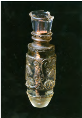
Abbildung 2: Ampulle, Gandersheim

nen siillum [ sigillum? ], in welchem Blut des Herrn eingeschlossen ist: unum siillum magnum aureum, in quo concluditur sanguis . 18 Wie das eindeutig verschriebene Wort siillum zu lesen ist, beschäftigt schon länger die Forschung. Wahrscheinlich ist sigillum gemeint, aber nicht im Sinne von Siegel, sondern von kleiner Figur oder sogar Gefäß. 19 Wie die Abarbeitungen im Bereich des oberen Halsringes und am unteren Ende des Flakons zeigen, wäre es denkbar, dass sie wie jenes Fläschchen gefasst war, das sich heute im Schatz von Aachen-Burtscheid (Abb. 1) befindet.