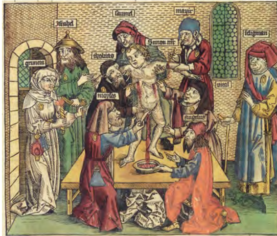
Abbildung: „Martyrium“ des Simon von Trento, Holzschnitt aus der Schedelschen Weltchronik

Dazu gehört vor allem der 1141 erstmals in Norwich fassbare Ritualmordvorwurf, der Juden unterstellte, dass sie das Blut von Christenkindern zu Pessach benötigten und diese deshalb heimlich töten würden. Dieser Vorwurf gipfelte schließlich darin, dass eines der angeblichen Opfer, Simon von Trento, nach einem kirchlich inszenierten Prozess gegen die Juden von Trento 1475 selig gesprochen wurde. 10 Sein Kult verbreitete sich mit Hilfe des in der Schedelschen Weltchronik abgedruckten Holzschnittes von 1493, der die angeblich Beteiligten bei der Marterszene namentlich vorstellt und damit den Status eines historischen Dokumentes beansprucht (vgl. Abb.).