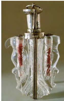
Abbildung 4: Flakon, Quedlinburger Domschatz

Unklar ist, welche der vielen Christusreliquien sich im Flakon mit den Vogelköpfen des Quedlinburger Domschatzes befinden (Abb. 4). 28 Das 18 cm hohe, prächtig geschnittene Gefäß ist – bis auf wenige Absplitterungen im unteren Bereich und den Verlust eines Vogelschnabels – in hervorragendem Zustand. Von den drei Bohrungen ist die mittlere leer, die beiden äußeren, innerhalb der beiden Vogelkörper befindlichen, sind mit Reliquien gefüllt, die ihrerseits in einen roten Seidenstoff gehüllt sind, so dass der Blick nicht auf die Reliquien selbst, sondern auf ihre textilen Hüllen fällt, die sich schemenhaft hinter dem geschnittenen Kristall abzeichnen. Der neuzeitlichen Überlieferung nach handelt es sich um Reliquien von den Windeln und Kleidern Christi. 29 Auch wenn ungewiss ist, welche Reliquien tatsächlich im Inneren der Röhrchen lagern, könnte der rote Stoff darauf hinweisen, dass auch Blutstropfen darunter sind. Für den Zeitpunkt der Reliquieneinlagerung gibt es einen Anhaltspunkt.