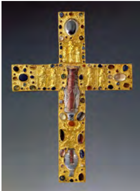
Abbildung 5: Stiftskreuz, Domkammer Münster

von beiden Seiten sichtbaren Kristalls ihre größte Wirkung entfalten kann. Dass es tatsächlich auf die Durchsichtigkeit des Gefäßes ankommt, zeigt die Stellung des oberen, größeren Fläschchens (Abb. 5a und b). Dieses ist nämlich so gedreht, dass nicht etwa der kostbare palmettenartige Kristallschnitt zur Geltung kommt, sondern die freie Fläche zwischen den Ornamenten. Dank dieser Drehung ist eine maximale Sicht auf den die Reliquien einhüllenden roten Stoff gewährleistet. 32 Die auf der Kreuzrückseite umlaufende Inschrift informiert über die Zusammensetzung des Heiltums: Neben einer Partikel vom Kreuzesholz und vom Schwamm der Tränkung Christi am Kreuz sind Reliquien verschiedener Heiliger aufgeführt.