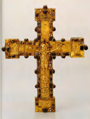
Abbildung 6: Erpkreuz

nach Vorstellung mittelalterlicher Gläubiger – zumindest in kleinen Mengen auch Blut Christi in die Ampulle gelangt, ist es doch das bei der Kreuzigung vergossene Blut, das die Kreuzpartikel heiligt. 36 Aber auch die im Flakon aufbewahrte Schwammreliquie ist für die Vorstellung, dass es sich bei dem fatimidischen Flakon um eine Art Kelch handelt, relevant. So berichtet im 7. Jahrhundert Adamnan in seiner Schrift De locis sanctis von dem in Jerusalem gezeigten, der Legende nach echten silbernen Abendmahlskelch, in dem auch ein Stück jenes Schwammes der Kreuzigung geborgen war, mit dem der Gekreuzigte getränkt worden war. 37