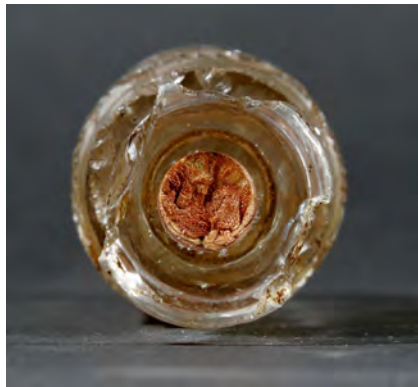
Abbildung 2a: Ampulle (Detail), Gandersheim

Dass Kristallgefäße zur Aufbewahrung von Blutreliquien verwendet wurden, bezeugen vor allem zwei prominente Stücke, von denen wir nur noch schriftliche Kunde haben. In der berühmten Heiligen Kapelle des Kaiserpalastes zu Konstantinopel wurde neben anderen Herrenreliquien auch ein Teil des von Christus vergossenen Blutes verwahrt. Die zahlreichen, Unmengen von Reliquien und Schätze dieser Kapelle aufzählenden Berichte beschreiben auch das Gefäß, in dem sich das kostbare Blut befand. So eine Urkunde um 1150: „ Monstratur etiam: cristallina Fiala, in qua ... de Sanguine Domine habetur “ (Auch zeigte man ein Gefäß aus Kristall, in dem sich ... Blut des Herrn befand). 20 Der Kreuzfahrer Robert de Clari erblickt in den Wirren des Vierten Kreuzzugs 1204 beim Plündern dieser Kapelle auch die dort angehäuften Schätze und stellt fest, dass sich eine große Menge des Blutes Christi in einer Phiole befand: „ si i trouva on, en une fiole de cristal, grant partie de sen Sanc “ (dort fand man, in einem Gefäß aus Kristall, viel von seinem