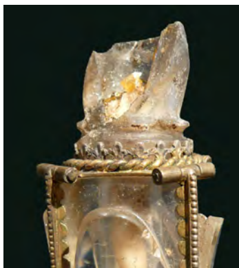
Abbildung 1a: Reliquiar (Detail), St. Johann, Aachen-Burtscheid

War das Täuferblut von Aachen-Burtscheid wie der in der Gandersheimer Stiftskirche hoch verehrte Blutstropfen Christi, der in einem ähnlichen Flakon aufbewahrt wird, auf einem textilen Träger appliziert? Auffällig ist, dass in Gandersheim der Blutstropfen durch roten Stoff optisch aufgewertet und vermeintlich sichtbar gemacht wird (Abb. 2). Während durch den geschliffenen Kristall allenfalls schemenhaft rotes Textil erkennbar ist, zeigt der im Mittelalter durch einen Verschluss wahrscheinlich nicht mögliche Blick in die Gandersheimer Flasche das erhaltene rote Gewebe, das als Träger des Heiligen Blutes dient (Abb. 2a). Auch in Gandersheim wird die Reliquie in einer heute allerdings ihres Kontexts beraubten Ampulle ausgestellt, die, aufwendiger als die von Burtscheid geschliffen, wohl fatimidischen Ursprungs ist. Spuren von Abarbeitungen an den ringförmigen Schlifflinien an Flaschenschulter und -fuß lassen erkennen, dass sie vormalig in einen anderen Zusammenhang integriert gewesen sein muss. Das Gandersheimer Schatzverzeichnis vom Anfang des 12. Jahrhunderts spricht von einem großen gold-