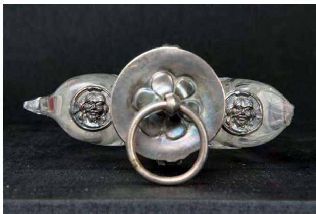
Abbildung 4a: Flakon Detail, Quedlinburger Domschatz

In der Aufsicht sind zwei fest mit einer Hülse verlötete Verschlussabdeckungen für die beiden äußeren Röhrchen sichtbar, die auf die Mitte des 13. Jahrhunderts datiert werden können (Abb. 4a). Es handelt sich um identisch kreisrunde, in der Matrize geschlagene nimbierte Christusmedaillons aus Silberblech, die wie ein Deckel fest auf den Reliquienglassen montiert sind. Dieses Motiv begegnet in ähnlicher Weise auf einem norddeutschen Buchdeckel und zwei Kelchen des 13. Jahrhunderts aus Haldensleben und aus dem Rheinland. 30