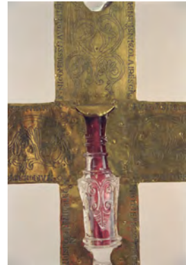
Abbildung 5b: Stiftskreuz (Detail, Rückseite) Domkammer Münster

Zwar sieht man nichts von den verborgenen Heiltümern, doch mag die mit Herrenreliquien gefüllte Ampulle an den (eucharistischen) Kelch unter der Kreuzigung erinnern, hat sich doch „die Platzierung des Kelches zu Füßen Christi am Kreuz schon in karolingischer Zeit zu einem eigenen Bildtyp verfestigt“. 33 Das Motiv des Kelches unter der Kreuzigung, Symbol für die Heilskraft Christi durch sein blutiges Opfer, ist im westdeutschen Raum im 11. Jahrhundert mehrfach nachweisbar, so bei dem im letzten Viertel des 11. Jahrhunderts ebenfalls im Bistum Münster entstandenen Erpho-Kreuz, wo der Gekreuzigte mit seinen Füßen direkt auf einem Kelch steht, 34 oder auf der gravierten Rückseite eines Reliquienkreuzes in der Domschatzkammer, Münster (Abb. 6 und 7). 35 Der rote, die Reliquien des Borghorster Kreuzes umhüllende Stoff erinnert an das Blut Christi, das den Kelch füllte. Durch die Reliquie vom Kreuz des Herrn ist –