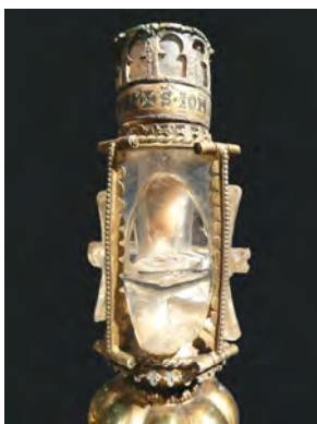
Abbildung 1: Reliquiar, St. Johann, Aachen-Burtscheid

dieser Zeit – nicht in Stoff eingeschlagen ist (Abb. 1a, Flaschenhals nach Entfernung der Manschette). Vermutlich barg der Flaschenhals einst eine Täuferreliquie, auf welche die ihn umschließende Manschette hinweist. Traditionell wird die Reliquie mit dem Blut Johannes des Täufers in Verbindung gebracht. 17 Das Blut hat die Zeiten nicht unbeschadet überstanden. Nach der Entfernung einer im 19. Jahrhundert hinzugefügten Turmarchitektur ist das Fläschchen heute oben offen. Der Betrachter kann in die Öffnung sehen, wobei der Blick auf eine gelbliche harzartige Masse fällt, die wohl kaum mit dem Täuferblut zu identifizieren ist, sondern eher als Verschlussmasse diente. Allerdings lässt sich unter der diesem kristallinen Belag ein Stoffstückchen ausmachen, das den Übergang zwischen Flaschenbauch und -hals abdichtet. Ob es sich dabei um den textilen Träger des Täuferblutes oder lediglich um einen textilen Verschlussstopfen handelt, lässt sich ohne restauratorische Maßnahmen nicht entscheiden.