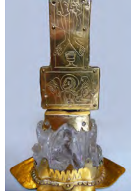
Abbildung 7: Reliquienkreuz, Domkammer Münster